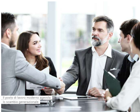
Il posto di lavoro moderno agevola lo scambio generazionale

Il ricambio a livello di forza lavoro è inevitabile, soprattutto quando una generazione subentra a un'altra a causa del pensionamento di quella precedente. Tuttavia, la fase di transizione non è sempre facile, poiché i dipendenti di lunga data dispongono spesso di conoscenze ed esperienze preziose, che non sono custodite per iscritto in un unico luogo. Una soluzione basata sul cloud consente di accedere a tale know-how in qualsiasi momento e ovunque ci si trovi. Se i collaboratori più giovani hanno maggiore familiarità con le più recenti tecnologie e possono aiutare quelli che fanno